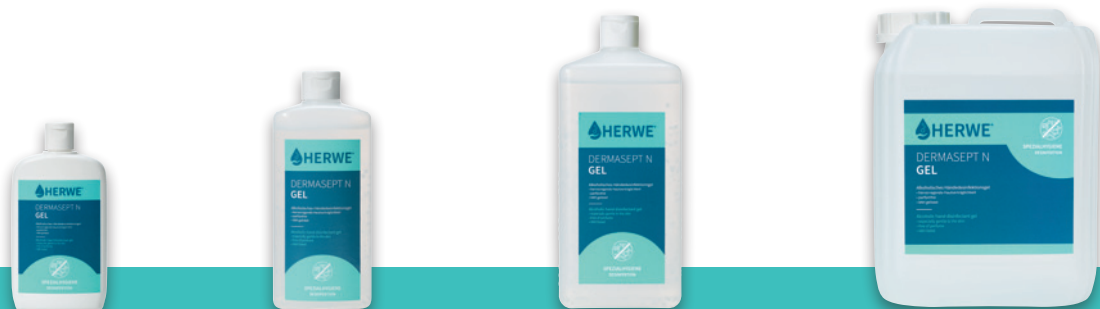
Kittelflasche 150 ml