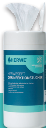
Spenderbox 120 Tücher