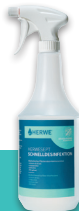
Keulenflasche 1.000 ml