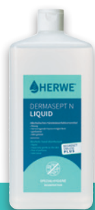
EURO-Spenderflasche 1.000 ml