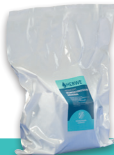
3 Nachfüllpackungen à 70 Tücher