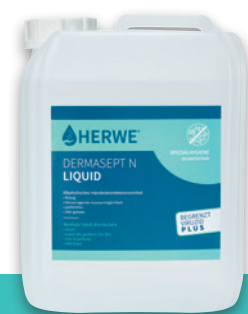
Kanister 5 Liter